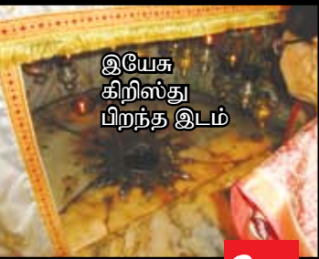
இயேசு கிறிஸ்து பிறந்த இடம்