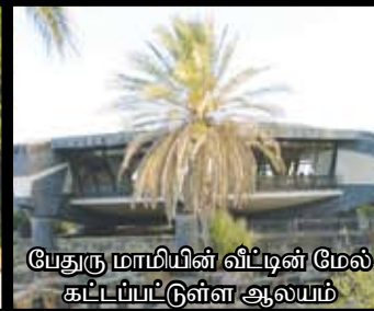
பேதுரு மாமியின் வீட்டின் மேல் கட்டப்பட்டுள்ள ஆலயம்