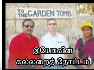
இயேசுவின் கல்லறைத் தோட்டம்