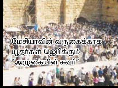
மேசியாவின் வருகைக்காக யூதர்கள் ஜெபிக்கும் "அழுகையின் சுவர்"