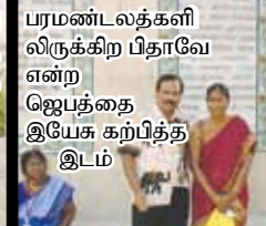
பரமண்டலங்களிலிருக்கிற பிதாவே என்ற ஜெபத்தை இயேசு கற்பித்த இடம்