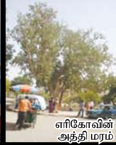
எரிகோவின் அத்தி மரம்