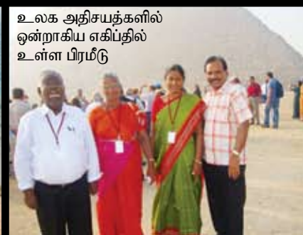
உலக அதிசயங்களில் ஒன்றாகிய எகிப்தில் உள்ள பிரமீடு