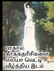
யாகால் தீர்க்கதரிசிகளை எலியா வெட்டி வீழ்த்திய இடம்