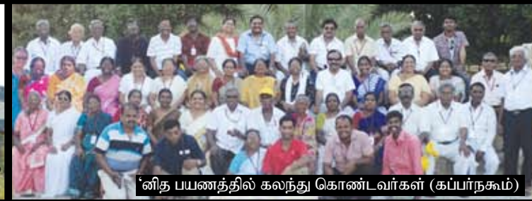
னித பயணத்தில் கலந்து கொண்டவர்கள் (கப்பர்நசும்)