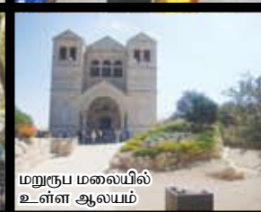
மறுருப மலையில் உள்ள ஆலயம்