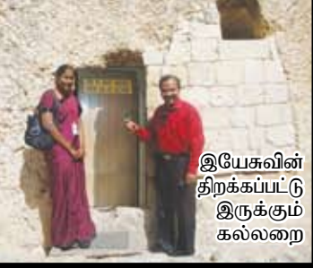
இயேசுவின் திறக்கப்பட்டு இருக்கும் கல்லறை