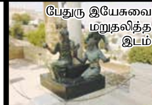
பேதுரு இயேசுவை மறுதலித்த இடம்

காத்தருக்குச் சித்தமானால் வருகிற 2011 ஆண்டு மே மாதத்தில் முதல் இரண்டு வாரங்களில் புனித பயணம் மேற்கொள்ள இருக்கிறோம். நீத்களும் எத்களோடு வாருங்கள் என அன்டன் அழைக்கிறோம். இதைக் குறித்த தகவலை அறிய 9841252836 (or) 044-26551936 என்ற தொலை பேசி எண்களைத் தொடர் கொள்ளும்படி அன்டன் கேட்டுக் கொள்கிறேன்.