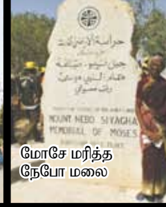
மோசே மரித்த நேபோ மலை