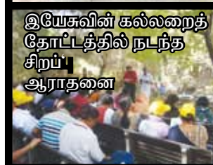
இயேசுவின் கல்லறைத் தோட்டத்தில் நடந்த சிறப்பு ஆராதனை